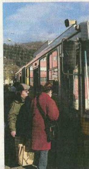
Žilina vrátila bezplatné cestovanie ľuďom nad 70 rokov.

Dôchodcovia môžu žilinskými trolejbusmi a autobusmi cestovať zadarmo, ak majú trvalý pobyt v Žiline a kúpia si za 100 korún mestskú čipovú kartu. Výnimkou je ranná špička počas pracovných dní. „Platí to v ranej špičke od piatej do ôsmej hodiny, kedy je doprava preťažená a primárne slúži na prepravu tých,