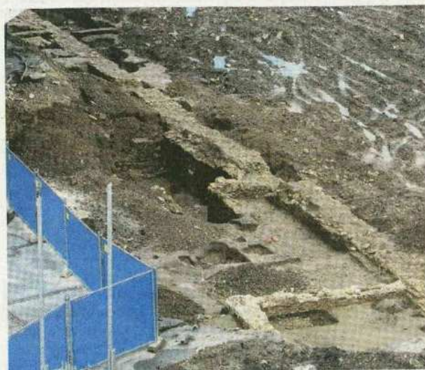
Stavenisko uprostred Trenčína zostalo ľudoprázdne. O to výraznejšie pôsobia starobylé hradby, čo odkryli archeológovia.

Pri trenčianskom Dome armády, kde majú vybudovať nákupné centrum Extrover-